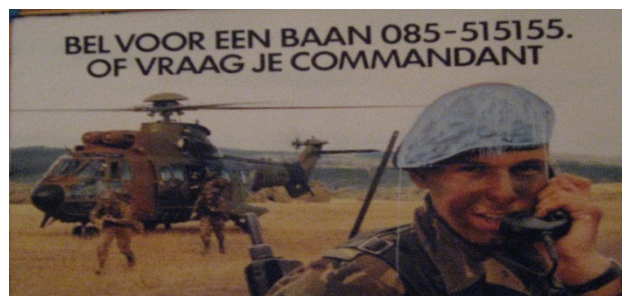
Figuur 3: aangepaste wervingsposter

Begin jaren 90 van de 20e eeuw werd intensief geworven voor de op te richten Luchtmobiele Brigade. Bij de toenmalige hoofdpoot van de genm. Kootkazerne was een bord met een levensgrote foto van een militair met de rode baret.