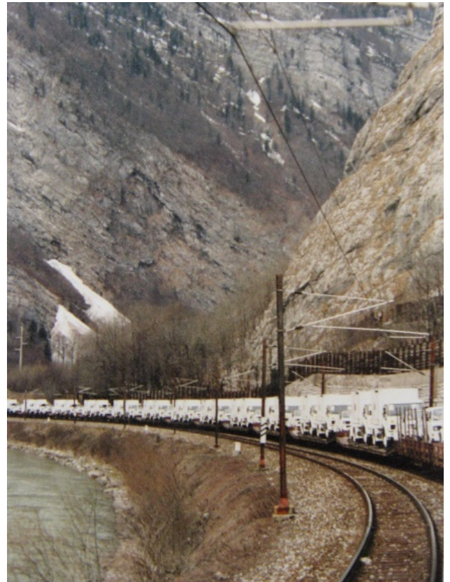
Figuur 9: het treintransport onderweg

De klasse V voorraad en de wapens werden zowel van de Advance Parties als van de hoofdmacht meegenomen door de hoofdmacht. Dezelfde dag (3 april 1992) zijn de wapens en munitie verstrekt; 40 patronen per UZI en 20 per pistool. Al het losse materieel is verdeeld over de verbindingsetachementen en alle voertuigen zijn voorzien van UNPROFOR-nummerplaten.