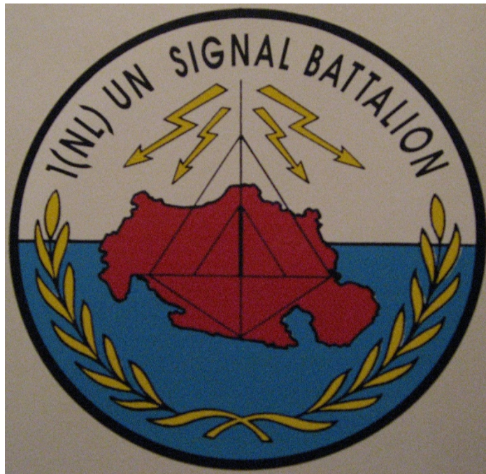
Figuur 4: bataljonslogo

Begin maart 1992 ontstond binnen de groep officieren en onderofficieren van de "oude" Staf 108 Verbindingsbataljon de idee voor een bataljonslogo. Binnen 48 uur werden er drie alternatieven aangeleverd. De keus viel op het nu bekende logo. Bij het bataljon was al ingestroomd de vaandrig Heere van de Directie Voorlichting BLS die het bataljonslogo door de Directie Voorlichting in Den Haag heeft laten maken. Dit speciaal logo werd op T-shirts, stickers, briefpapier, mokken, broekriemgespen en het bataljonsschild aangebracht.