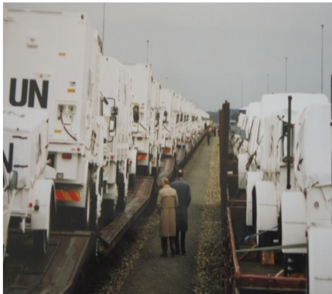
Figuur 8: gereed voor vertrek naar Zagreb

Op 2 april 1992 vertrok al het overige personeel - 229 militairen- in 6 touringcars vanaf de genm. Kootkazerne. Aankomst in Zagreb: 3 april rond het middaguur. Daarnaast werden