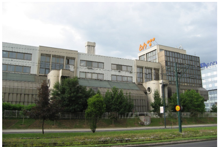
Figuur 7: FHQ UNPROFOR in "PTT"-gebouw; Sarajevo

In de Sectoren waren eind maart/begin april de verkenningen ook voltooid en was het wachten op de infanterie-eenheden. Als locaties waren hotels gekozen, maar ook kazernes, school- of partijgebouwen. Het Russisch bataljon had gekozen voor de niet meer in gebruik zijnde luchthavengebouwen van het vliegveld Osijek.