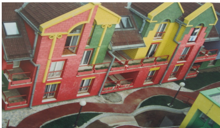
Figuur 6: binnenplaats van Rainbow

De Force Commander en zijn plaatsvervanger werden in het centrum van Sarajevo gelegerd en de hogere stafofficieren van UNPROFOR in een hotel buiten Sarajevo. Begin april 1992 werden alle militairen van Staf 1(NL)UN SIGBN in Rainbow gelegerd tezamen met militairen van een aantal andere nationaliteiten: o.a. Zweden, Noorwegen en Frankrijk.