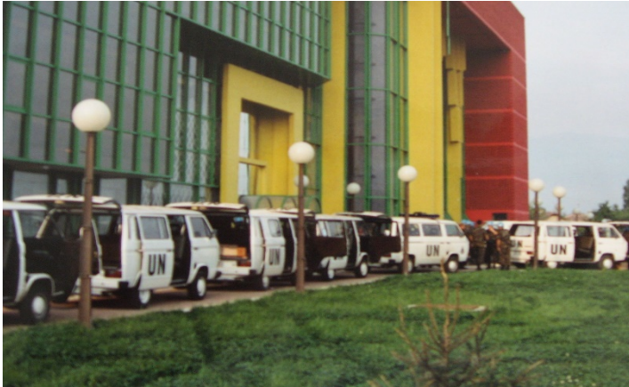
Figuur 14: Acht combi's verplaatsten staf 1(NL)UN SIGBN