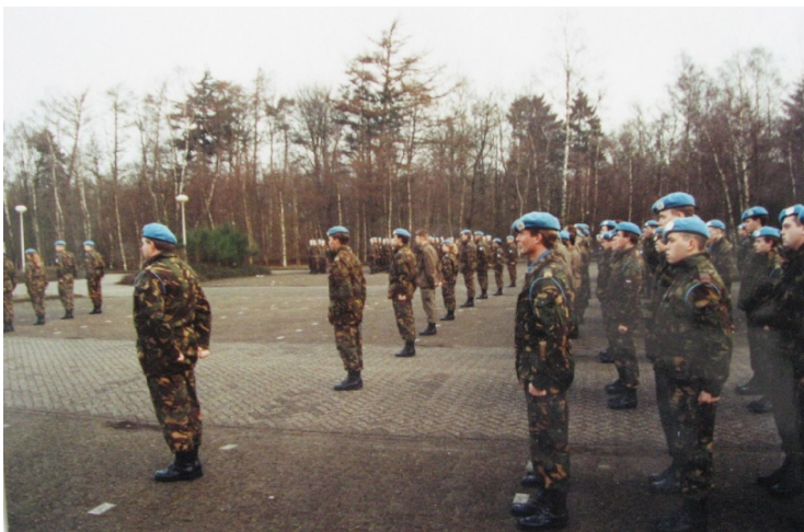
Figuur 2: bataljonsappel in Garderen

Teneinde de benodigde saamhorigheid te bevorderen is in maart 1992 een aantal maatregelen genomen, zoals: