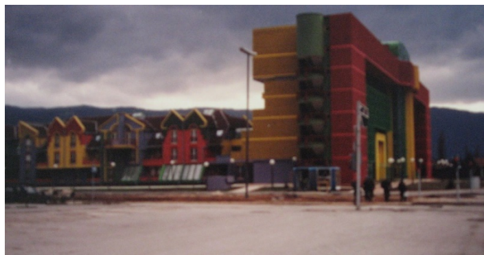
Figuur 5: donkere wolken bij Rainbow

Dit huis werd snel het RAINBOW -hotel gedoopt vanwege de vele kleuren waarin het was geschilderd.