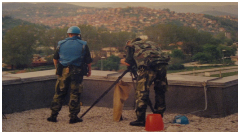
Figuur 11: uitkijkpost op dak Rainbow

De veiligheidsmaatregelen in en rond Rainbow werden aangescherpt: zandzakken werden rond het gebouw gelegd - met name rond de ingang- en op het dak werd een mitrailleurpositie ingenomen en bemand door de Zweden.