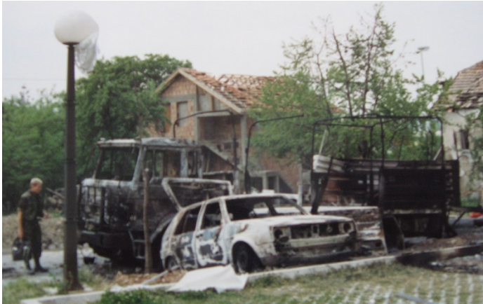
Figuur 12: Maarten Beneker "inspecteert" de in brand geschoten 4-tonner

plunjebalen in een 4-tonner beladen. Tijdens dit beladen werden regelmatig snerpemde geluiden gehoord van voorbijvliegende kogels van een sluipschutter!