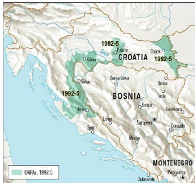
Figuur 1: UNPA's